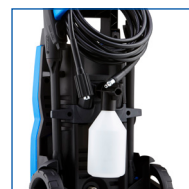
RANGEMENT DES ACCESSOIRES