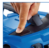
DÉCOLMATAGE ÉLECTRONIQUE DU FILTRE