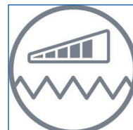
INDICATEUR DE SATURATION DU FILTRE