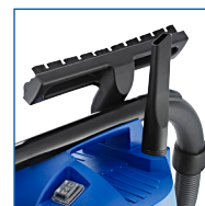
RANGEMENT FACILE DES ACCESSOIRES