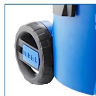
BONNE STABILITÉ ET MANIABILITÉ